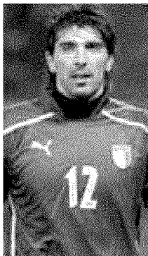
Dall'alto, Marcello Lippi e Gianluigi Buffon. A fianco, la Coppa del Mondo che sarà protagonista sabato 28 ottobre al Teatro Ariston di Acqui Terme